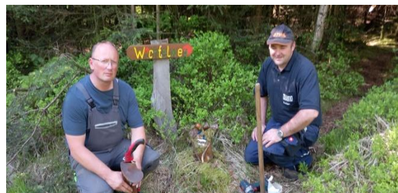
Anlegen des Wichtelweges

Die Erhaltung dieses außergewöhnlichen Lernortes und Spielplatzes, auch als barrierefreier Treffpunkt für alle Generationen und Menschen aller Nationen, ist und bleibt primäres Ziel!