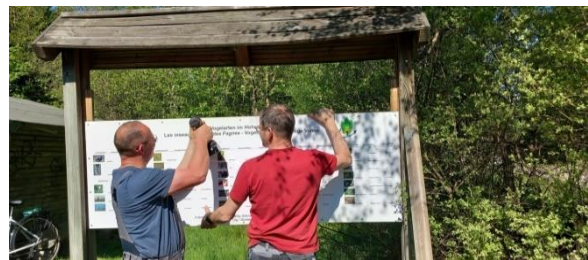
Installation der neuen Vogeltafel