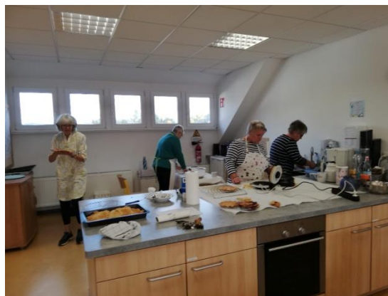
Dafür gibt es aber Waffeln

„O-Ton“ einer Bäckerin: “Was können die Kinder denn dafür, dass es keine Äpfel gibt?”