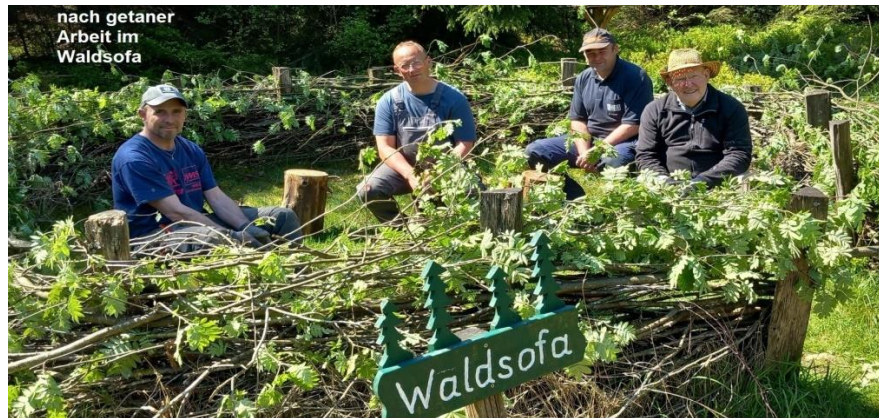
nach getaner Arbeit im Waldsofa